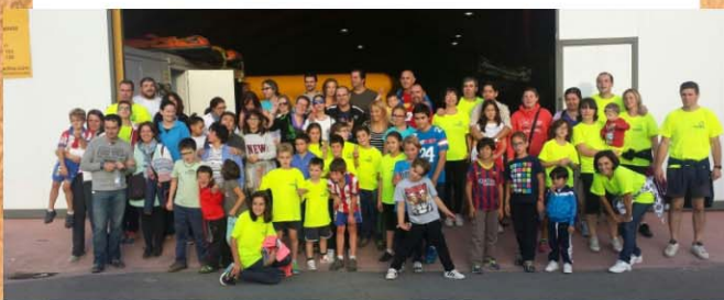
Imagen del IX Encuentro de Familias en Salamanca