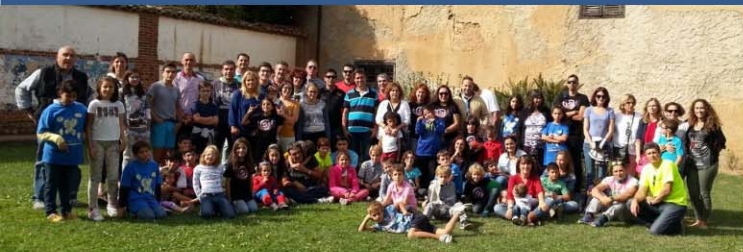
Imagen del X Encuentro de Familias en Hospital de Órbigo (León)

CONSEJO REGULADOR DE ASOCIACIONES DE PADRES Y MADRES DE NIÑOS CON DEFICIENCIA AUDITIVA DE CASTILLA Y LEÓN