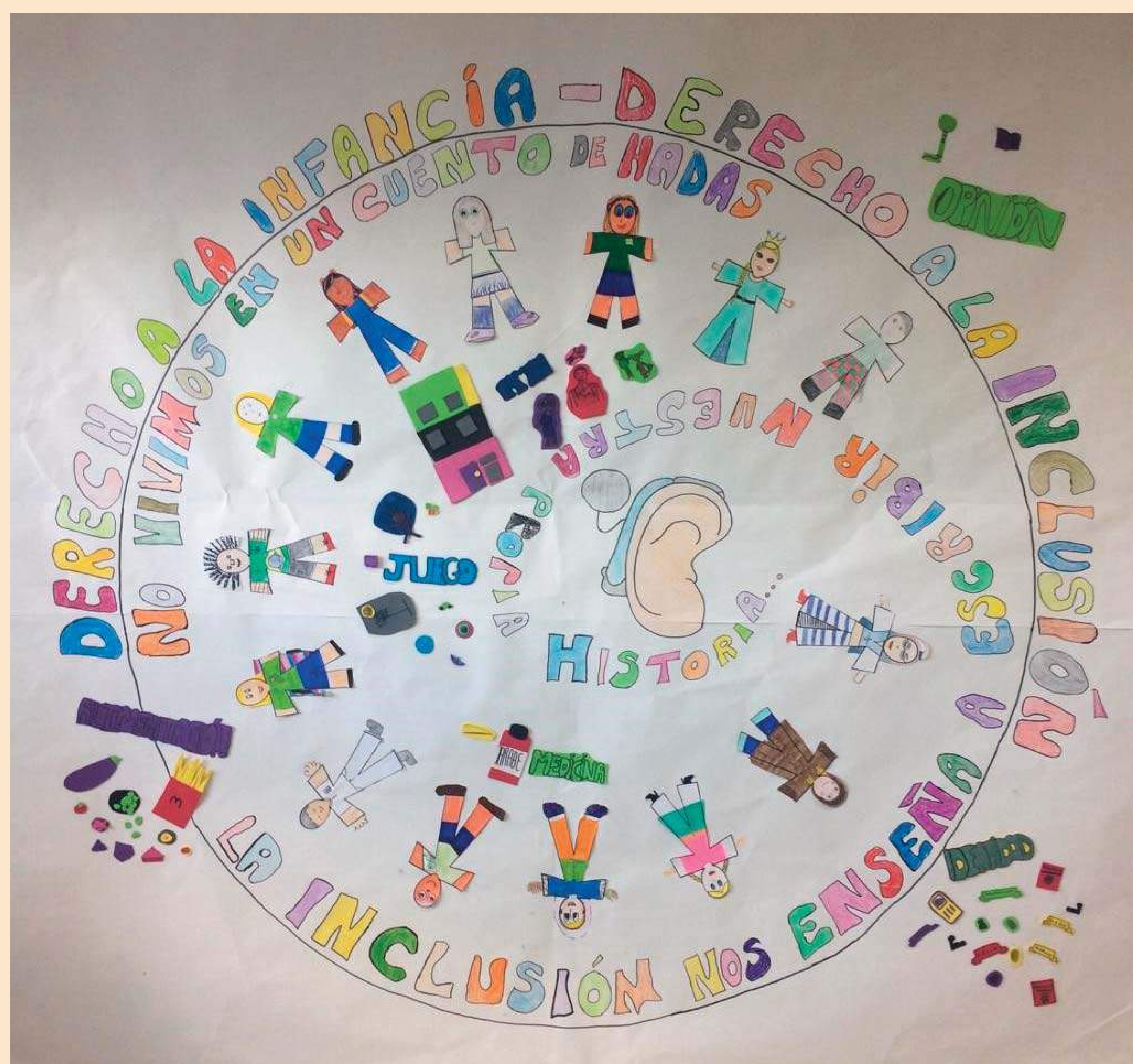
ASOCIACIÓN ENTENDER Y HABLAR (MADRID)